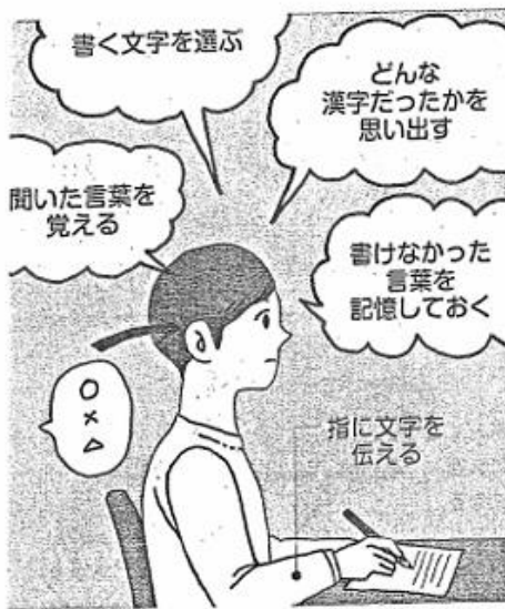
脳の複数の回路を同時に使うことが認知症の予防・改善につながる